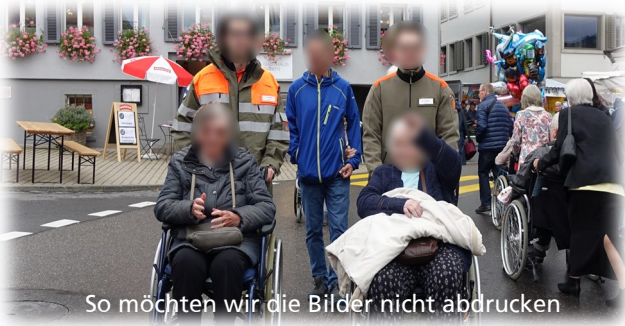
So möchten wir die Bilder nicht abdrucken