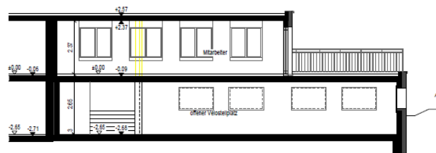
Schema-Schnitt A Variante 1

Wir möchten für die Zukunft gerüstet sein. Der Stiftungsrat hat beschlossen, sich dem Thema „Zukunft“ im nächsten Jahr einen ganzen Tag zu widmen. An diesem Tag sollen die Weichen für die Zukunft gestellt werden. Um eine möglichst grosse Wissensvielfalt zu bekommen, wurde beschlossen, externe Fachreferenten zum Thema Alter, Bedürfnisse und Wohnformen einzuladen. Der Stiftungsrat ist überzeugt, so die richtigen Schritte einzuleiten, um in Zukunft eine Institution zu sein, welche zu einem guten Preis- Leistungsverhältnis das richtige Angebot hat.