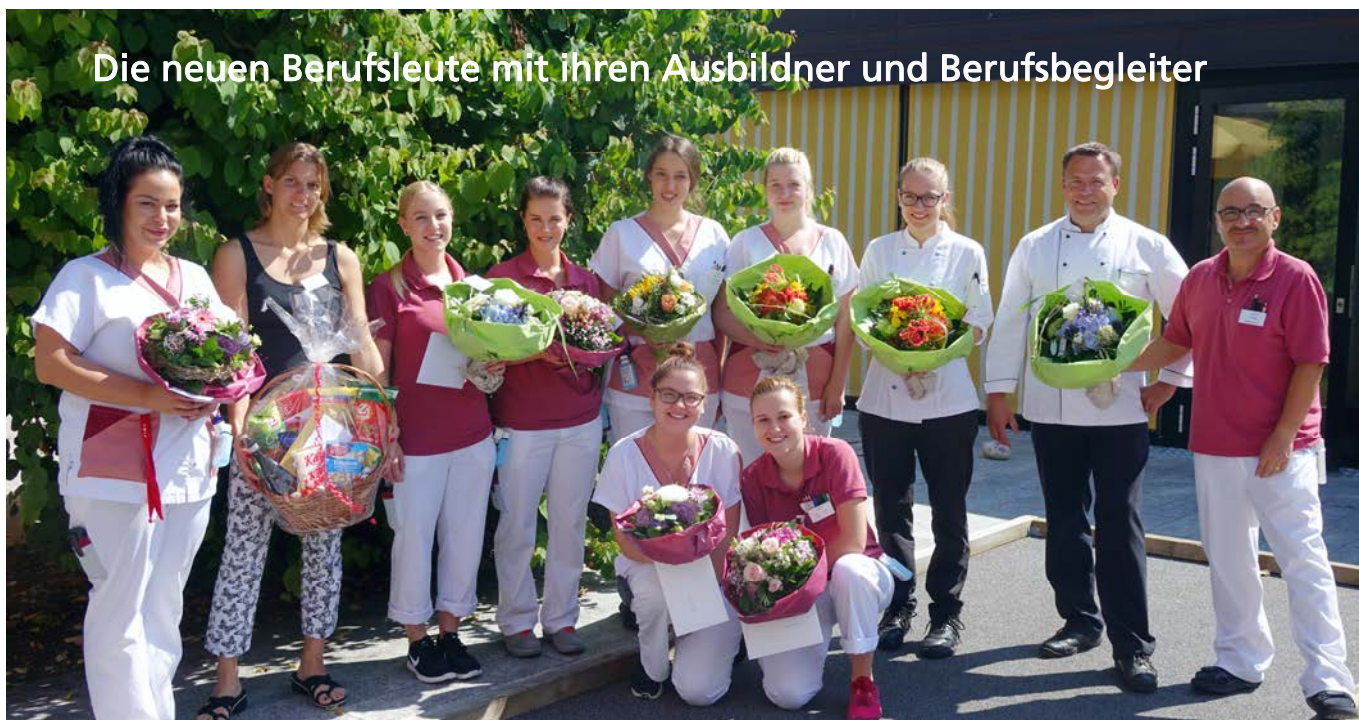
Die neuen Berufsleute mit ihren Ausbildner und Berufsbegleiter