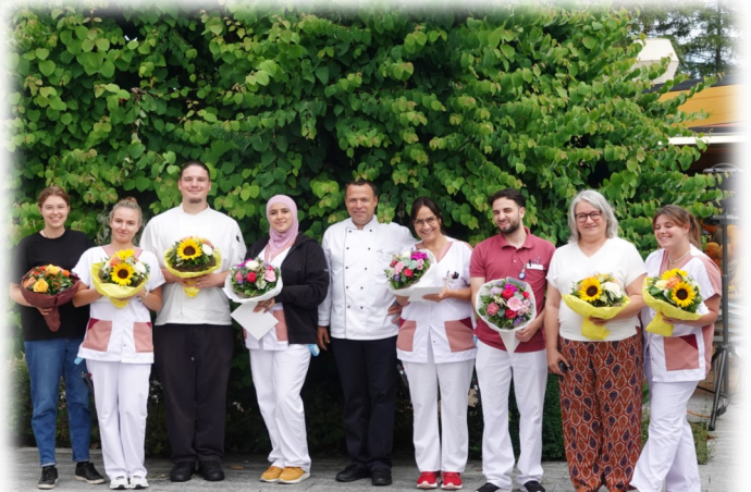
Lernende mit Ausbildungsverantwortlichen

geht in die weite Welt hinaus und sammelt an anderen Orten neue Erfahrungen. Wir haben jedoch ausserordentlich grosse Freude, dass alle Lehrabgänger weiterhin im erlernten Beruf bleiben und wer weiss, vielleicht dürfen wir sie wieder einmal im Chlösterli begrüssen – «Uf Wiederluege!»