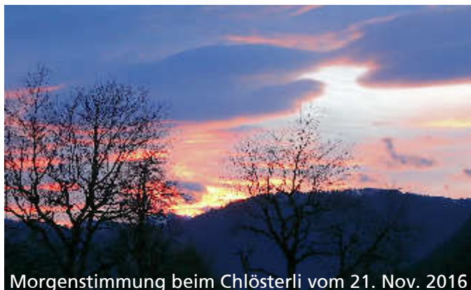
Morgenstimmung beim Chlösterli vom 21. Nov. 2016