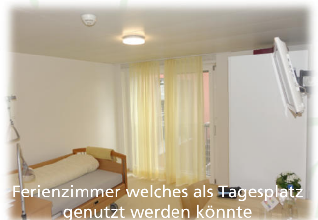
Ferienzimmer welches als Tagesplatz genutzt werden könnte

Das Chlösterli hat durch die durchdachte, flexible Bauweise bei der Erweiterung gewisse zusätzliche Räumlichkeiten geschaffen, welche mit kleinen Anpassungen als Zimmer genutzt werden können. Da diese Räume nicht benutzt wurden und die Nachfrage nach Plätzen über eine grosse Zeit gross war, wurden diese Einheiten auch genutzt, sei es für Notfalleintritte oder auch als Ferien- oder Überbrückungsbetten. Im Kanton Zug ist festgelegt, wie viele Pflegebetten eine Institution betreiben darf. Durch die erwähnte Umnutzung haben