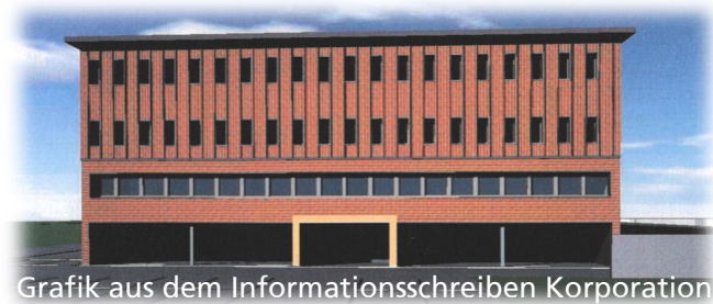
Grafik aus dem Informationsschreiben Korporation

Der Rechnungsabschluss lag provisorisch vor. Der Stiftungsrat konnte zur Kenntnis nehmen, dass auch in betriebswirtschaftlicher Hinsicht das Jahr sehr erfolgreich war. Dies vor allem durch eine sehr hohe Bettenauslastung, welche in diesem Umfang nicht zu erwarten war. Dies war nur durch die Flexibilität aller Mitarbeitenden möglich. Der Stiftungsrat dankt an dieser Stelle allen Mitarbeitenden herzlich für ihren grossen Einsatz.