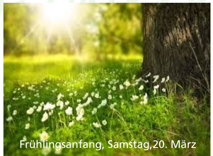
Frühlingsanfang, Samstag, 20. März