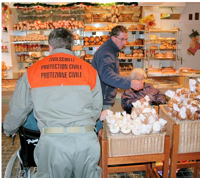
Ausflug mit Zivilschutz Zug im Jahr 2005 nach Einsiedeln

üben, sind wir dankbar, wenn sich einige Bewohnerinnen und Bewohner, welche bereit sind mitzumachen, direkt im Sekretariat melden.