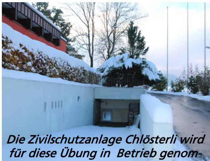
Die Zivilschutzanlage Chlösterli wird für diese Übung in Betrieb genom-

Am 15. und 16. November wird jeweils am Morgen mit einer Gruppe eine Evakuierung in die Sanitätshilfsstelle geübt. Von ca. 9.00 bis 11.00 Uhr müssen dann die Zivilschützer Bewohnerinnen und Bewohner betreuen. Die diesjährige Übung soll in einem reduzierten Rahmen zeigen, wie eine solche Aussiedlung ablaufen könnte und welche Punkte verbessert werden können bzw. müssen. Um dies möglichst realistisch zu