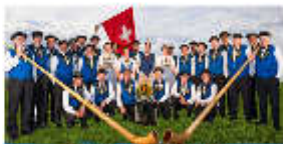
Jostklub vom Agerstal