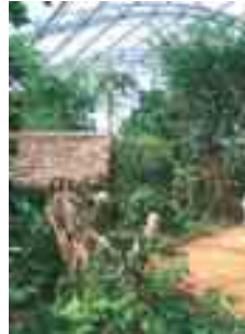
Der Masoalaregenwald im Zoo Zürich.

Im Februar sind folgende Exkursio- nen geplant: