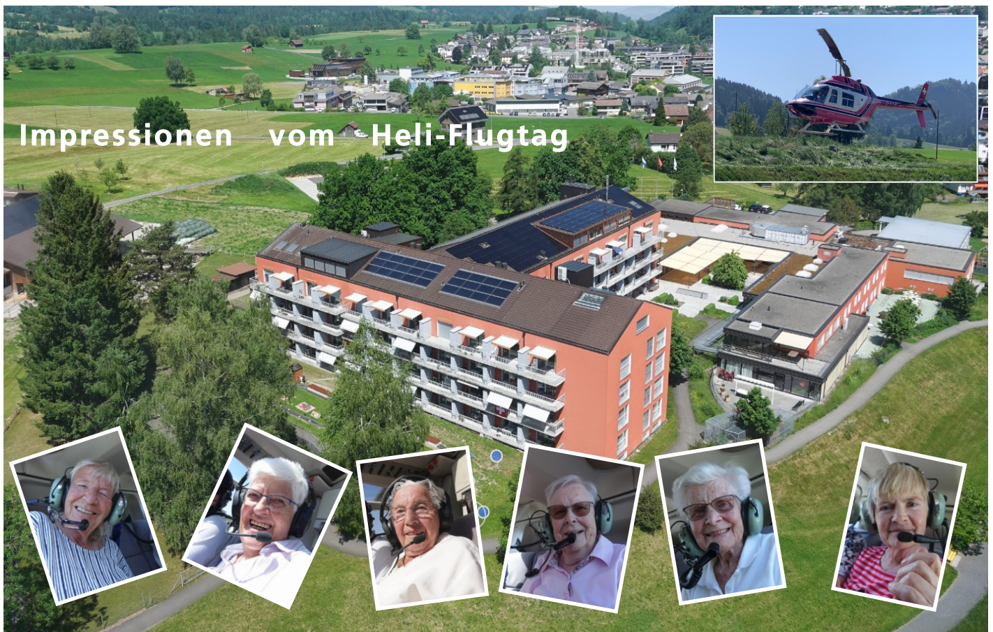
Impressionen vom Heli-Flugtag

Es handelt sich dabei lediglich um optische und informative Änderungen. Dennoch ist es hilfreich, den Grund dafür zu kennen.